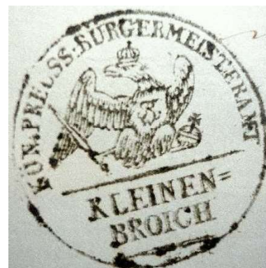
Siegel 1855: „Königlich Preussisches Bürgermeisteramt Kleinenbroich“; Stadtarchiv Korschenbroich, Archiveinheit B1-0063